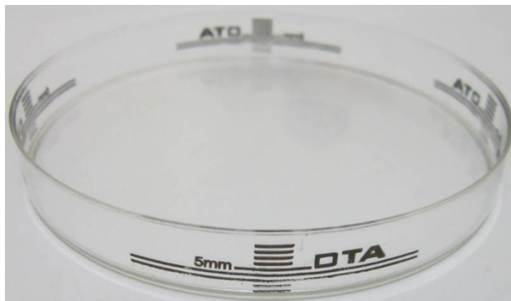
شکل 1 دو خط بلند جهت تعیین ضخامت استاندارد محیط کشت طبق CLSI

برای این کار ابتدا از هر کدام از پتردیش‌های شاهد 20