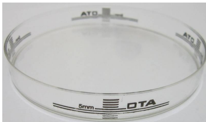
شکل 1 دو خط بلند جهت تعیین ضخامت استاندارد محیط کشت طبق CLSI

برای این کار ابتدا از هر کدام از پتردیش‌های شاهد 20