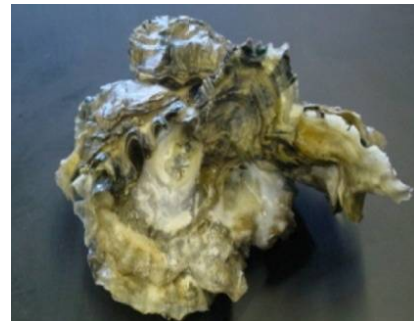
شکل 1 نمای مورفولوژیک دوکفه‌ای Crassostrea gigas

نمونه‌های آب دریا و دوکفه‌ای Crassostrea gigas در اسکله بهمن قشم جمع آوری قرار گرفتند (شکل 1). نمونه آب دریا از عمق 15 cm و دوکفه‌ای نیز از مناطق ساحلی که احتمال حضور نفت وجود داشت از عمق 10 الی 15 متری به وسیله غواصی در ظروف استریل جمع‌آوری و روی یخ به آزمایشگاه منتقل شد. نمونه‌ها در دمای 4^\circ C تا انجام آنالیزهای بعدی قرار داده شدند. برای تعیین میزان تراکم و تنوع باکتری، ازسطوح درونی دوکفه‌ای‌ها در آزمایشگاه نمونه‌برداری صورت گرفت [7].