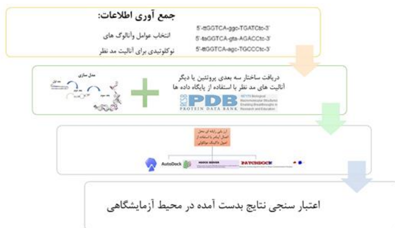
شکل ۲ تصویری کلی از مراحل in silico SELEX

باید در حیوانات تولید شوند و به چندین دوز تقویت کننده نیاز دارند. به‌طور کلی، تولید آنتی‌بادی یک فرایند زمان‌بر چند ماهه است. همچنین، آنتی‌بادی‌ها مستعد تغییرات ناحیه‌ای هستند و بنابراین محققان از بحران تکرارپذیری رنج می‌برند. علاوه بر این مشکل، طولانی