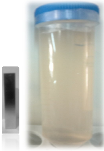
شکل 1 محیط کشت اختصاصی در کنار آهن ربا

علاوه بر سه محلول گفته شده ترکیبات ( KH_2PO_4 ) فسفات پتاسیم مونو بازیک، L(+)-Tartaric acid، Succinic acid، NaNO_3 نترات سدیم، Na-thioglycolate (SIGMA Aldrich-Germany)، Na-Resazurin acetate (SIGMA-USA) به محلول اضافه می‌شود. سایر مواد محصول شرکت Merck آلمان می‌باشد. محیط‌های کشت به صورت شکل 1 نگهداری شدند.