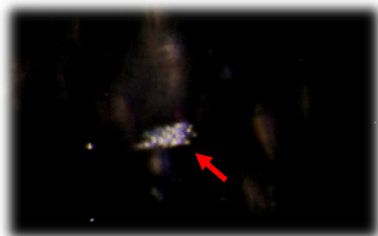
شکل 6 نمونه تالاب میقان اراک، عکس PCM با بزرگنمایی

مشاهدات تکمیلی با استفاده از میکروسکوپ فاز متضاد حرکت باکتری را تحت اثر میدان مغناطیسی نشان داد. تصاویر تهیه شده در شکل‌های 6 و 7 گویای این جهت‌گیری مغناطیسی است.