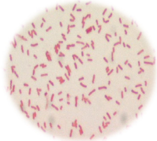
شکل 2 تصویر میکروسکوپ نوری با بزرگنمایی 1000 برابر پس از رنگ‌آمیزی گرم از نمونه تالاب میقان اراک

شکل‌های 2 و 3 به ترتیب رنگ‌آمیزی گرم از نمونه‌های تالاب میقان و معدن آهن را نشان می‌دهند.