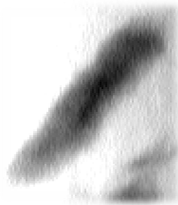
شکل 5 نمونه معدن آهن مروارید زنجان، عکس TEM