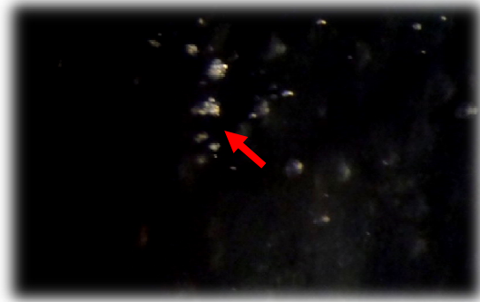
شکل 7 نمونه معدن آهن مروارید زنجان، عکس PCM با بزرگنمایی 400 برابر