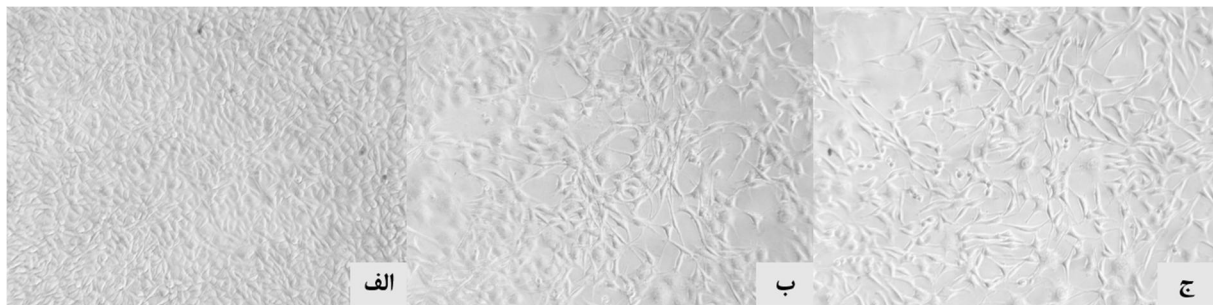
شکل 3 الف- سلول‌های PC12 قبل از تیمار با پروتئین نوترکیب NGF، ب- پس از یک هفته انکوبه شدن در محیط کشت حاوی NGF تجاری و ج- پس از یک هفته انکوبه شدن در محیط کشت حاوی NGF بیان شده همراه با چپرون TF.

افزوده شدن پروتئین نوترکیب به محیط کشت، مورفولوژی سلول‌ها شروع به تغییر کرد و پس از گذشت یک هفته سلول‌های شاخص عصبی در زیر میکروسکوپ مشاهده گردیدند. به عنوان کنترل از NGF تجاری خریداری شده از شرکت سیگما نیز استفاده شد. شکل 3 (الف) تصویر سلول‌های PC12 را قبل از تیمار با پروتئین نوترکیب نشان می‌دهد و شکل‌های 3 (ب) و 3 (ج)، عکس سلول‌های PC12 را پس از تیمار با NGF تجاری و بیان شده با چپرون TF نشان می‌دهد. همانطور که ملاحظه می‌شود، پس از گذشت یک هفته، سلول‌های تیمار شده با NGF تجاری و NGF بیان شده همراه با چپرون TF به سلول‌های عصبی تمایز پیدا کرده‌اند (30 و 29).