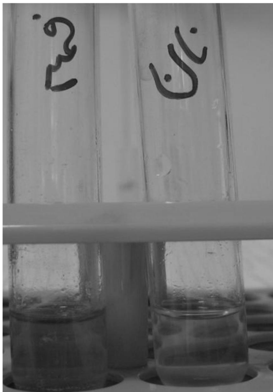
شکل ۱ بررسی میزان نشاسته در نمونه خمیر و نان داری باکتری

آزمایش انجام شده با استفاده از معرف لوگول، شدت رنگ کمتری را در نمونه نان مورد آزمایش نسبت به خمیر نشان داد، که این امر حاکی از آن است که نشاسته در نان پخته شده توسط باکتری‌های موجود در آن هیدرولیز شده است.