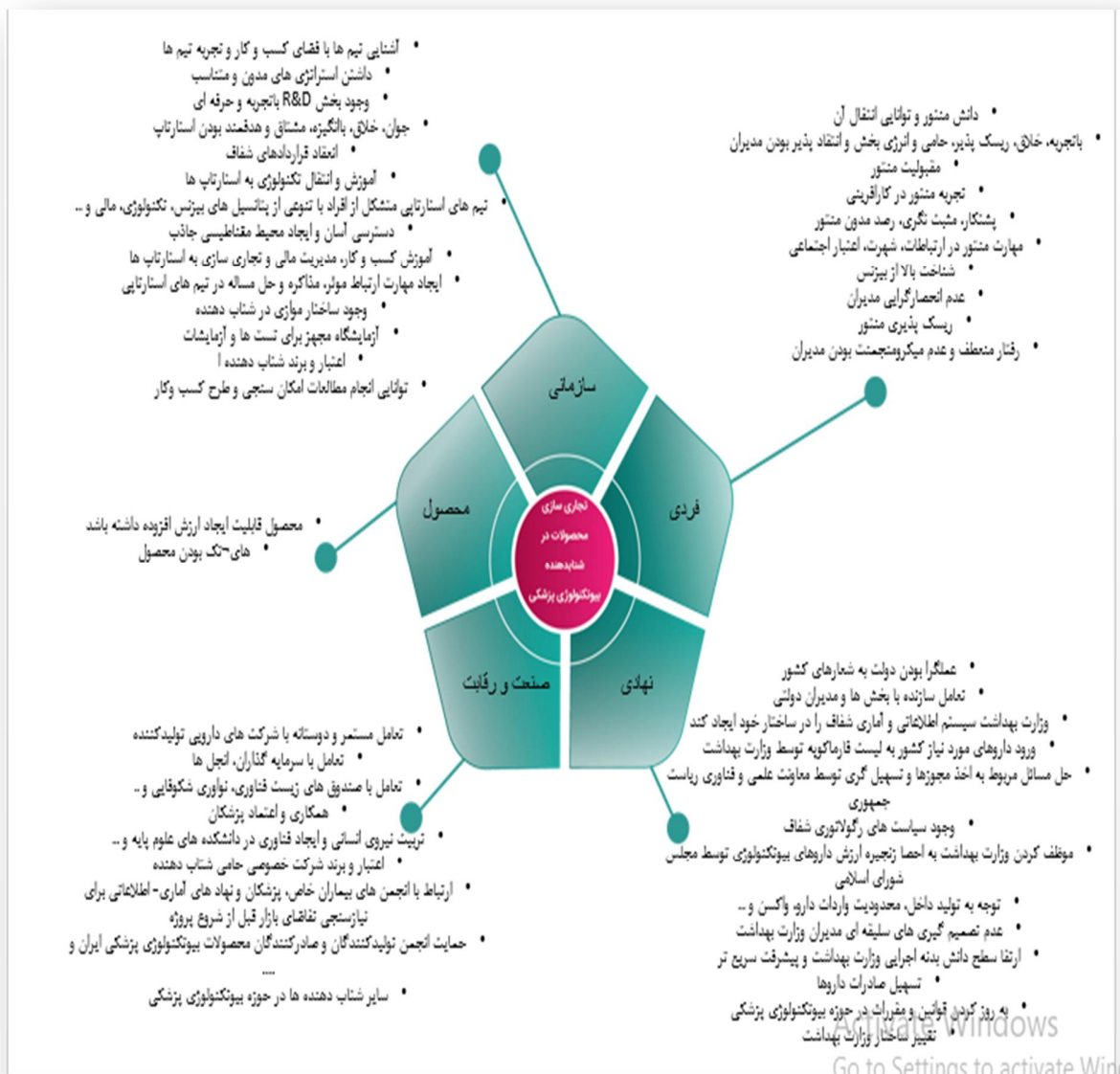
شکل 2 چارچوب عوامل مؤثر بر تجاری سازی محصولات در شتاب دهنده های زیست فناوری پزشکی ایران (بر اساس جمع بندی پژوهشگران)

نرم افزار رتبه بندی شدند. در شکل زیر چارچوب نهایی به دست آمده از تحلیل نشان داده شده است (شکل 2).