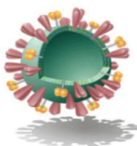
شکل 2 تصویری از یک لیپوزوم پگلیه شده

گونه ای در کنار یکدیگر قرار می گیرند که سر هیدروفوب (آب گریز) آنها به سمت داخل کره و قسمت هیدروفیل (آب دوست) آنها در سمت خارج کره وجود دارد. به این ترتیب یک ساختار کروی دولایه تشکیل می شود و این نحوه جهت گیری، امکان بارگیری داروهای آب دوست در هسته و داروهای آب گریز در پوسته لیپوزومها را امکان پذیر می سازد [34]. از ویژگی های مهم نانولیپوزومها می توان به کاهش عوارض جانبی دارو، افزایش اثربخشی دارو، پایین آوردن سمیت و افزایش پایداری اشاره کرد. همچنین پژوهشگران با انجام آزمایش های فراوان به این نتیجه رسیده اند که استفاده از پوشش بر نانولیپوزومها باعث افزایش پایداری فیزیکی آنها می شود، برای مثال می توان به پوشش هایی از جنس کیتوسان و پلی اتیلن گلیکول اشاره کرد. در بیشتر موارد برای تولید نانولیپوزومهایی که در سیستم گردش خون پایداری بیشتری داشته باشند، از نانولیپوزومهای پوشش داده شده با پلی اتیلن گلیکول (پگلیه شده) استفاده می شود که در شکل 2 به آن اشاره شده است. مولکول های درشت پلی اتیلن گلیکول قادرند با اتصال به مولکول های فسفولیپیدی جداره لیپوزوم، حامل های اختصاصی ایجاد کنند [34].